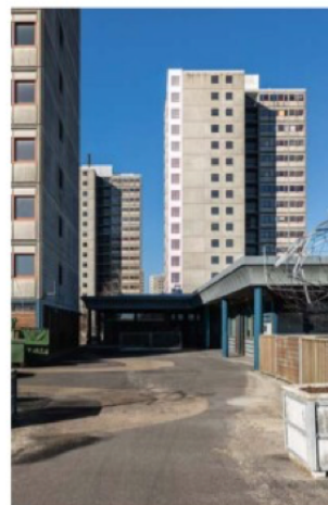
Der er tænkt meget over rummene i området, for eksempel kan man som fodgænger bevæge sig gennem hele området uden at støde på biltrafik. Brøndby Strand Parkerne består både af høj- og lavhuse. Efter nedrivningen er der syv højhuse tilbage.